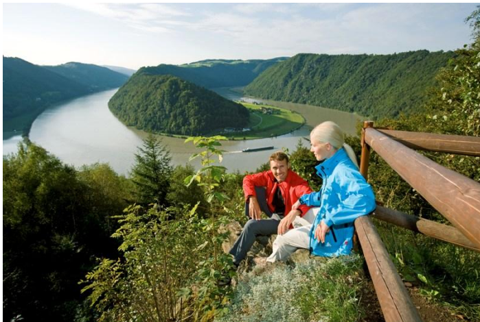
Ilustrația 3 Donausteig – Cotul Dunării la Schlögen

În Austria Superioară există ruta Donausteig, care în cea mai mare parte