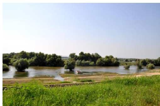
Ilustrația 11 Dunărea în Moldova

Principalele țări de proveniență a turiștilor sunt România și Turcia, urmate de