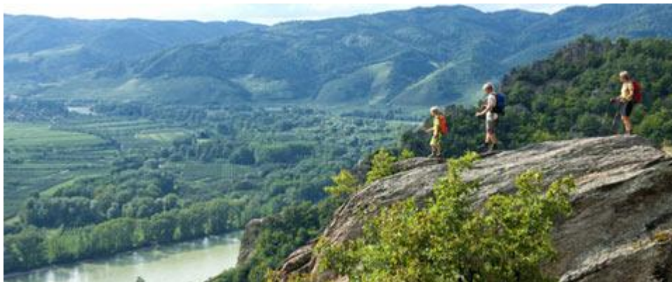
Ilustrația 4 Traseul Welterbesteig Wachau

În noiembrie 2011, societatea Danube NÖ GmbH a inițiat un proiect de creare a unor poteci pentru drumeții în zona Nibelungen (Nibelungengau), de la Sarmingstein (Austria Superioară) la Emmersdorf (Austria Inferioară) în nord și de la Ybbs la Melk în partea de sud.