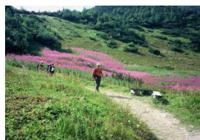
Ilustrația 5 Drumeție în Slovacia

Turismul de drumeție reprezintă o componentă deosebit de promițătoare a industriei turistice din Slovacia: lungimea totală a potecilor marcate depășește 14 000 km. Peste 95% dintre aceste trasee se găsesc în zona de deal a țării ( http://www.telecom.gov.sk/index/index.php?ids=119830 ).