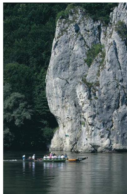
Ilustrația 2 Defileu al Dunării în Germania

Zona propice drumețiilor care urmează neîntrerupt cursul Dunării în Germania ar putea fi optimizată prin standardizarea marcajelor turistice, a popasurilor, a hărților și a datelor GPS, prin realizarea unui proiect de clasificare și acordare de etichete de calitate pentru unitățile de cazare care îndeplinesc cerințele excursioniștilor, precum și prin posibilitatea de a rezerva pachete de drumeții.