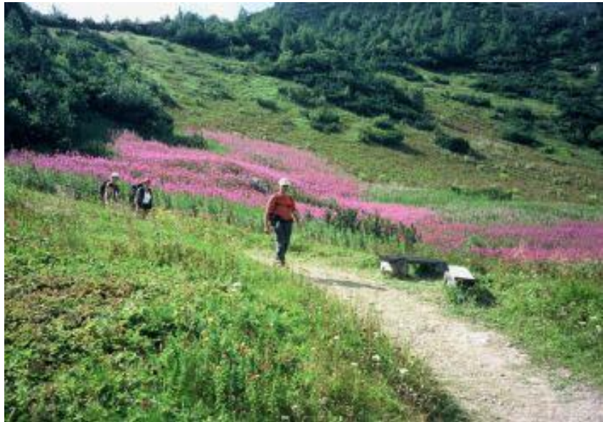
Снимка 5 Пешеходен туризъм в Словакия

Пешеходният туризъм в Словакия е популярен поради Европейските пешеходни пътеки за ходене на дълги разстояния, а освен това Е8 пресича регионите на Братислава и Търнава ( slovakiaholidays.org/walking.htm )