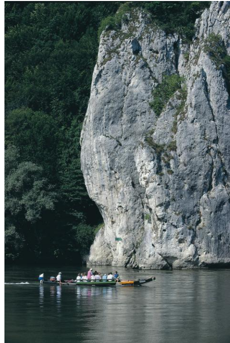
Снимка 1 Ждрелото на Дунав в Германия

Що се отнася до продължителността на престоя, едnodневните пътувания без нощувка са преобладаващи. Повечето туристи пристигат със собствен автомобил.