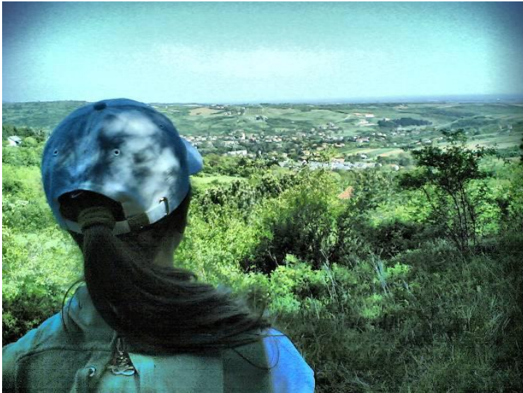
Снимка 8 Туристи в Нови Сад, Сърбия

Река Дунав влиза в Сърбия близо до Безани, продължава по протежение на границата между Хърватия и Сърбия, след това преминава през Нови град и Белград и най-накрая напуска страната близо до Рам. Реката минава през осем региона и общата ѝ дължина в Сърбия е 587 km. Регионите са следните: Западна Сърбия, Южна Бака, Срем, Белград, Южен Банат, Подунавие, Браничево и Бор.