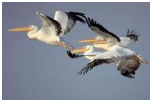
Снимка 12 Пеликани в Украйна

Дунав влиза в Украйна близо до езерото Кахул, в района на Одеса, а след това влиза в Резервата в делтата на река Дунав преди накрая да стигне до Черно море. Рени и Измаил са директно разположени на река Дунав. Предвид факта, че румънско-украинската граница преминава покрай Резервата в делтата на река Дунав, посещението на резервата предоставя преживяване сред природата за посетителите. Пешеходните туристи в рамките на региона на Одеса основно идват от по-близките околности и само малцина идват от Русия или други страни.