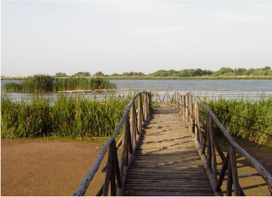
Снимка 10 Пътека при делтата на Дунав