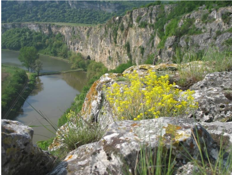
Снимка 9 Река Дунав при Русенски Лом, България

Стара планина, Родопите, Средна гора, Витоша в околностите на София, страната предлага добре изградена инфраструктура за пешеходен туризъм. Също така, Европейските пешеходни пътеки за ходене на дълги разстояния Е4 и Е3 преминават през