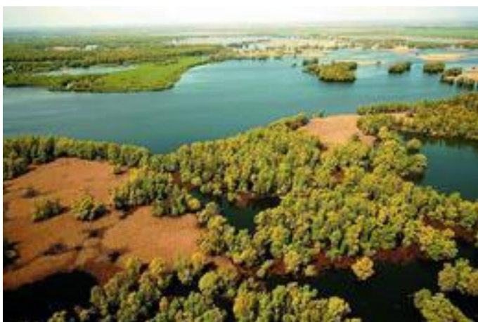
Снимка 7 река Дунав в Хърватия

Хърватия предлага широка мрежа от туристически пътеки, най-вече в районите по протежение на Средиземно море, и островите, съответно. Въпреки, че туризъм не е основната туристическа дейност в Славония, съществува потенциал за сътрудничество. Няма събрана информация за туристите с помощта на въпросници.