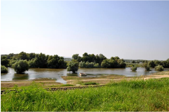
Снимка 11 Река Дунав в Молдова

басейна на долен Прут и само 20 до 30 км от мястото на вливането на Прут в Дунав, се намират езерата Манта и Белеу. ( www.tur.md/eng/section/762/ ).