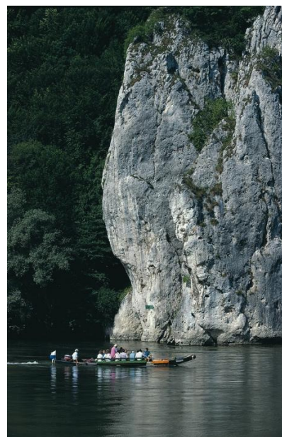
Obrázok 2 Dunajská úžina v Nemecku

K optimalizácii dokonale prepojenej turistickej oblasti pozdĺž Dunaja v Nemecku by mohlo prispieť štandardizované značenie turistických trás, štandardizované odychové stanovišťa, mapy a GPS navigačné informácie, ďalej projekty hodnotiace kvalitu a udeľovanie značky kvality poskytovateľom služieb v súlade s požiadavkami turistov, a možnosť rezervácie balíčkov služieb.