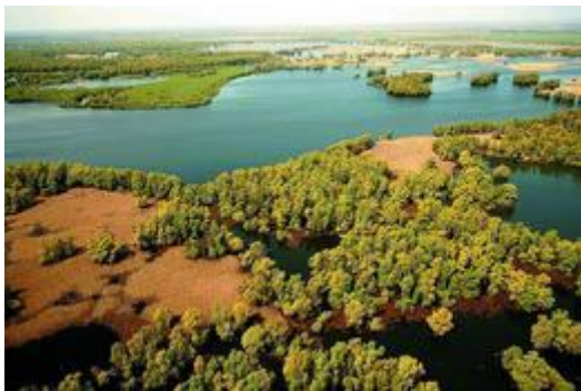
Obrázok 7 Dunaj v Chorvátsku

Organizácia Danube Competence Centre (DCC) a jej Oddelenie pre medzinárodnú spoluprácu, úzko spolupracuje s organizáciou TINTL ako aj s Chorvátskou organizáciou pre agroturizmus a cykloturistiku. Aj to je predpoklad pre ďalší rozvoj turistickej infraštruktúry s využitím prebiehajúcich projektov implementovaných DCC, zameraných na rozvoj cykloturistiky a pešej turistiky ( danubecc.org/index.php?pg=list-of-members ).