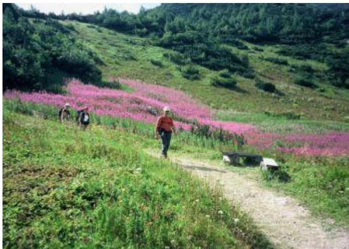
Obrázok 5 Pešia turistika na Slovensku

Na Slovensku Dunaj tečie na 172 kilometrovom úseku od Bratislavy až po maďarské pohraničné mesto Ostrihom. Na tejto ceste sa Dunaj vinie územiami 3 krajov: Bratislavským, Trnavským a Nitrianskym, ktoré sú pomenované po regionálne najväčších mestách. Nielen hlavné mesto Bratislava priťahuje turistov, ale aj technické pamiatky ako starodávne vodné mlyny alebo nádherná príroda ako napríklad záplavové lesy sú vyhľadávaným lákadlom pri Dunaji.