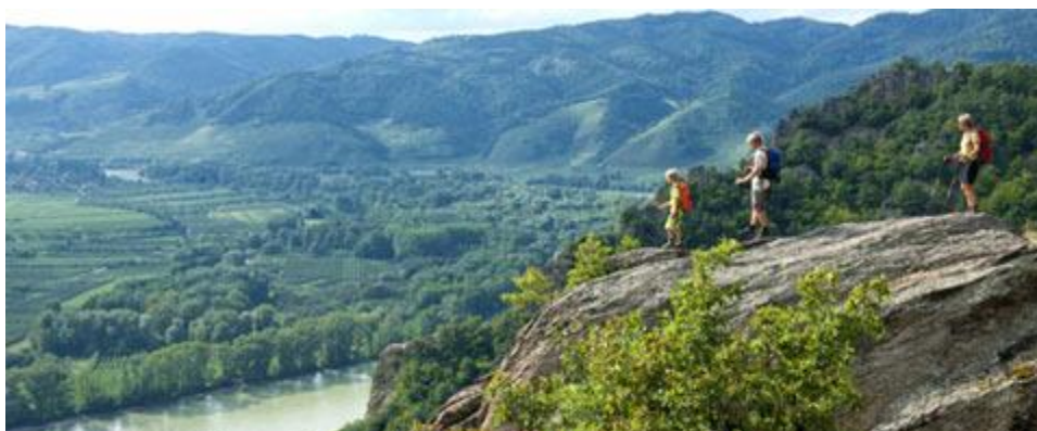
Obrázok 4 Lokality svetového dedičstva, údolie Wachau

Vzhľadom na to, že v Dolnom Rakúsku nie je žiadna organizácia alebo inštitúcia zodpovedná za turistické značenie, tak súkromná spoločnosť Donau Nieder-österreich Tourismus sa rozhodla zabezpečiť časť značenia spomínanej púte Cesta svätého Jakuba. V Hornom Rakúsku sa trasa prelína už so spomínanou trasou Donausteig na južnom brehu Dunaja ( www.jakobswege-a.eu ). Nakoľko je ale trasa púte Cesta Svätého Jakuba značená iba v jednom smere, nie je najideálnejším riešením pre poprepájanie turistických trás v Rakúsku.