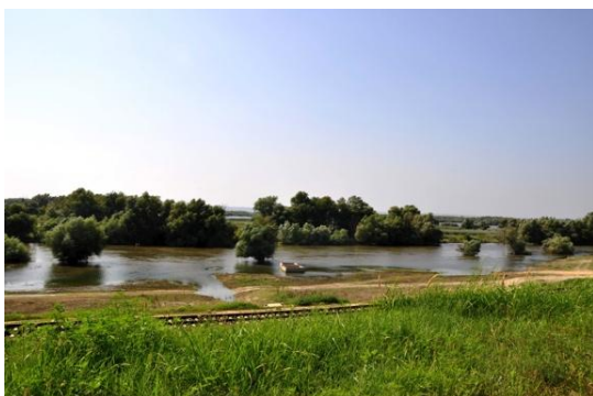
Obrázok 11 Dunaj v Moldavsku

Dunaj prechádza Moldavsko v blízkosti mesta Cahul. Do krajiny zasahuje svojim povodím približne na 340 m. Približne jeden milión ľudí žije v povodí rieky Dunaj na moldavskom území, ale len 8% územia zaberajú sídla. V regióne Cahul v dolnom povodí rieky Prut, približne 20 až 30 kilometrov od sútoku rieky Prut a Dunaj sa nachádzajú jazerá Manta a Beleu ( www.icpdr.org/icpdr-pages/moldova.htm ).