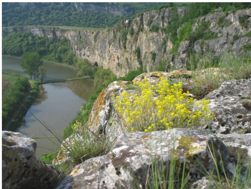
Obrázok 9 Dunaj v oblasti Russenski Lom, Bulharsko

V Bulharsku tvorí Dunaj hranicu so susedným Rumunskom a dĺžka toku je približne 471 km. Dunaj je aj jedinou riekou s plavebnou dopravou v krajine ( www.bulgarien-web.de/Geographie.84.0.html ).