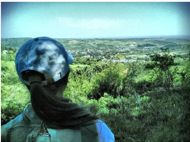
Obrázok 8 Turista v Novom Sade, Srbsko

Rieka Dunaj priteká na územie Srbska v blízkosti mesta Beždan a ďalej pokračuje tvoriac hranicu medzi Chorvátskom a Srbskom. Na svojej púti stretá mestá Novi Sad a Beograd, aby nakoniec opustila krajinu neďaleko mesta Ram. Rieka na tomto území s dĺžkou toku 587 km preteká ôsmimi regiónmi: Zapadana Bačka, Južna Bačka, Srem, Beograd, Južni Banat, Podunavile, Braničevo a Bor.