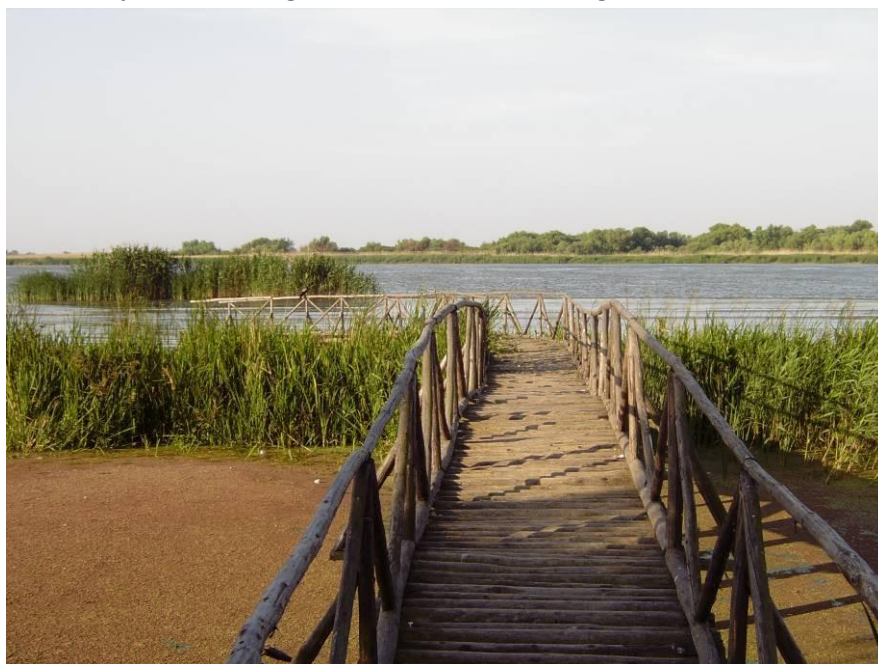
10. kép: A Duna-delta túraútja

Romániában a Duna 12 megyén folyik keresztül: Krassó-Szörény, Mehedinti, Dolj, Olt, Teleorman, Galati, Giurgiu, Calarasi, Constanta, Lalomita, Braila és Tulcea területén ömlik a Fekete-tengerbe. A Duna makrorégióját nagyfokú nyelvi, etnikai és vallási sokszínűség jellemzi. A DATOURWAY transznacionális projekt keretében, amely a Duna középső és alsóbb szakaszain a turizmus fejlesztését tűzte ki célul, a Romániára vonatkozó elemzés azt a tényt támasztja alá, hogy a terület az elégtelen hozzáférhetőség és az alacsony