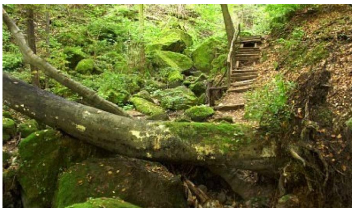
6. kép: Túraút egy magyar erdőben

A Duna magyarországi szakasza 417,20 km. Több jelentősebb város emelkedik a partjain: Győr, Komárom, Esztergom, Visegrád, Szentendre,