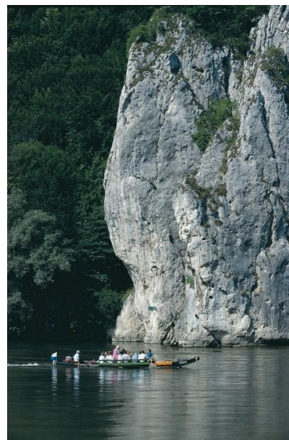
2. kép: A Duna-áttörés Németországban

Németországban a Duna mentén elhelyezkedő, teljesen folyamatos túraútvonalak optimalizálása pihenőhelyek, térképek és GPS által biztosított adatok, minőségprojekt és a vendéglátók minőségi osztályozása segítségével szabványosítható, ezáltal téve eleget a kirándulók és a lefoglalható túraajánlatok kívánalmainak.