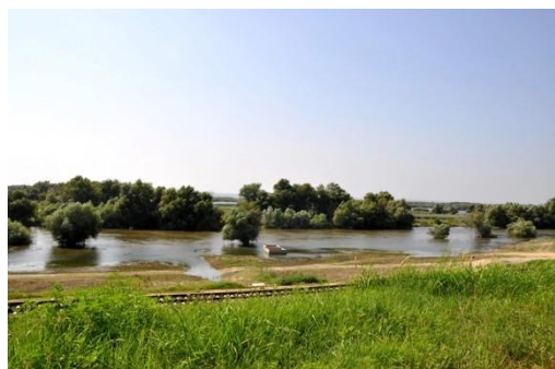
11. kép: A Duna Moldovában

A természetjárók jellemzően a következő országokból jönnek: Románia és Törökország, ezt követi Oroszország, Ukrajna valamint Olaszország ( www.tur.md/eng/section/1762/ ). Moldova hivatalos weboldala alapján, az ország fő turisztikai formái falusi jellegűek – kiváltképp a borturizmus, kulturális turizmus és a gyógyturizmus ( www.moldova.md/en/turism/ ). A kérdőíveken keresztül nincsen információ a túrázókról. Habár a természetjáró infrastruktúra hiányos, lenne lehetőség a falusi és borturizmus szektorában a természetjáró turizmus fejlesztésére.