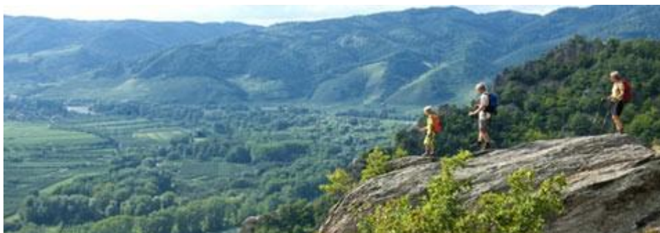
4. kép: Weiterbesteig Wachau

északon és Ybbs településtől Melkig délen.