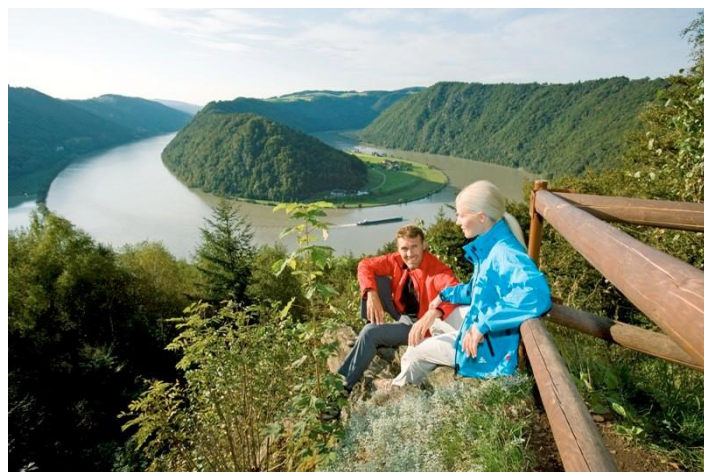
3. kép: Donausteig – A schlögeni Duna-kanyar

Felső-Ausztriában található a Donausteig, amely nagyrészt a folyó mindkét partján halad. Az északi parton a bajor városban, Passauban kezdődik, Linzen keresztül a Strudengau régióba vezet, majd St. Nikola-ban ér véget. A déli parton a Donausteig Passautól Linzen keresztül Enns városáig tart. Az egész útvonalat 23 szakaszra osztották. 40 túrán lehetőség nyílik a fő gyalogút elhagyására és a Duna régió környezetének felfedezésére.