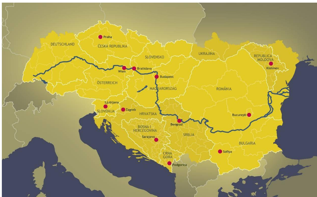
1. kép: A Duna folyása

A Duna 2880 km-es hosszával a második legnagyobb folyó Európában. E jelentős folyam Németországban ered. Érinti Ausztriát, Szlovákiát, Magyarországot, Horvátországot, Szerbiát, Romániát és Moldovát, majd végül a Duna-deltán keresztül Ukrajnában, a Fekete-tengerbe ömlik. Ezért sok európai ország osztozik a Duna gazdasági, természeti és turisztikai lehetőségeiben. Összeköti az egykori vasfüggöny két oldalán található kelet- és nyugat-európai államokat, kultúrákat, népeket és ideológiákat.